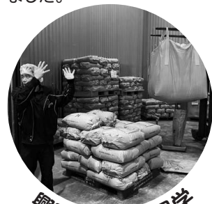
興味深い施設見学

また、『安全・安心』なお米や野菜がコープの組合員に提供されるまでの流れを施設見学も含めて見せていただき、産地の方々のたゆまぬ努力に感慨深いものを感じました。野菜たっぷりランチバイキングと田舎まんじゅう作りで初対面の参加者同士も和気あいあい♪ 限られた時間ではありましたが、学びの多い大満足な企画となりました！