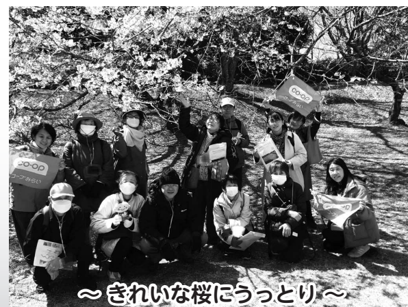
～きれいな桜にうっとり～